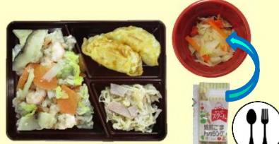
八宝菜 揚げぎょうざ 切干大根とハムの炒め物 キャベツの和え物