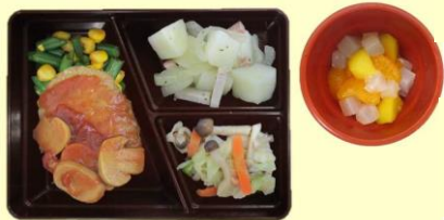
チーズインハンバーグ・添え野菜 ジャーマンポテト キャベツとしめじのソテー ナタデココフルーツ