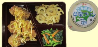
油淋鶏(エリチー) ちくわの炒り煮 小松菜のごま和え ミルクプリン