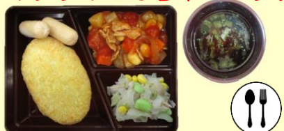
かぼちゃコロッケ・ウィンナー ポークビーンズ 野菜炒め コンソメスープ