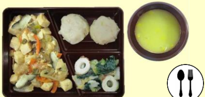
マーボー豆腐 えびしゅうまい 白菜と小松菜のナムル 中華風コーンスープ