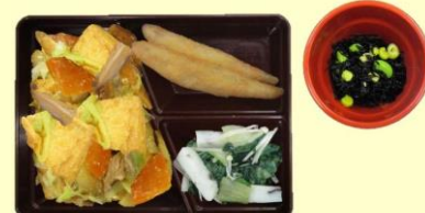
厚揚げのみそ炒め わかさぎのフリッター 大阪しろなの煮浸し ひじきのサラダ