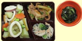
いかとじゃがいもの煮物 牛肉とピーマンのオイスター炒め 春雨の炒め物 きゅうりとわかめの酢の物