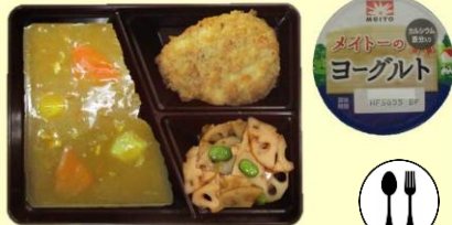
カレーライス 一口カツ れんこんソテー ヨーグルト