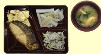
さわらの幽庵焼き・たけのこのおかか煮 じゃがいもの中華炒め 牛肉のしぐれ煮 みそ汁