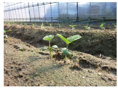
種をまいて10日後、芽が出ました。