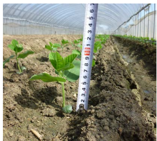
10センチ弱まで育ちました。