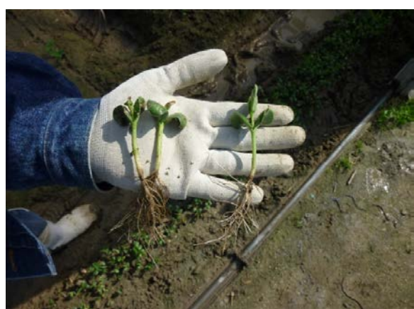
育たなかった苗は抜き取ります。